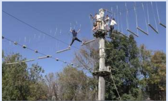
Ensemble, Écouter, Sentir et Regarder...