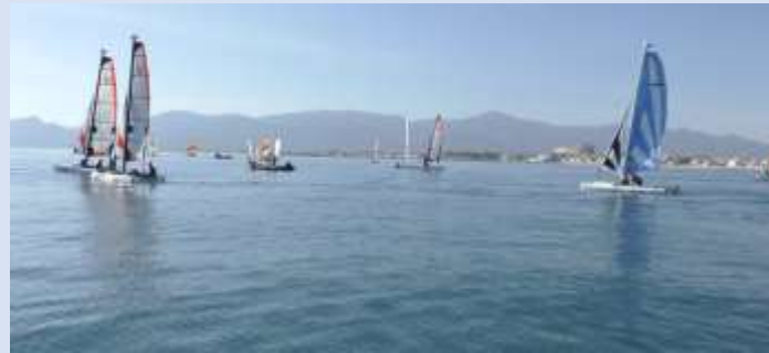
Navigation dans la « pétrole », pas si facile...