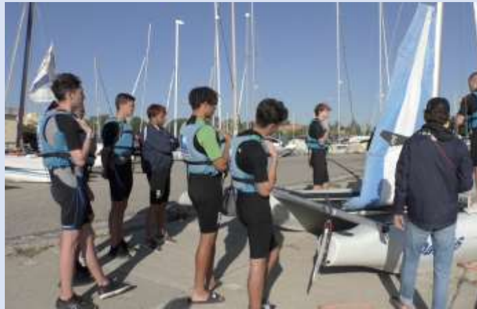
Mais quand il y a trop de houle....